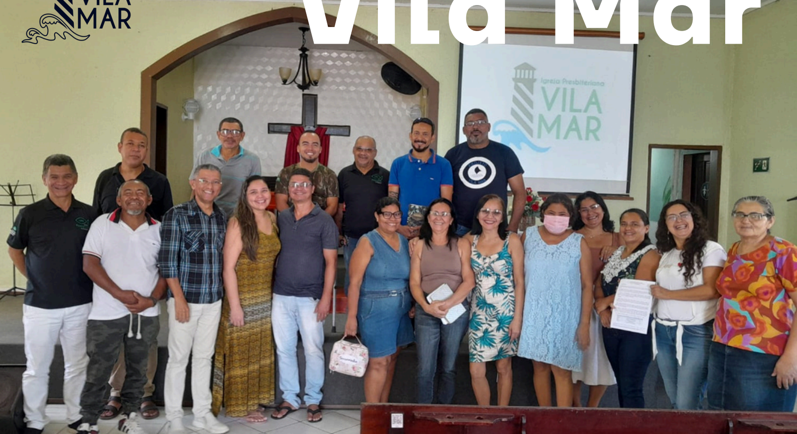
Foto: Classe dos Adultos na EBD Vila Mar - Junho 2025